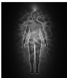
Figura 2 – Aura humana.

Denomina-se aura a carapaça existente em torno do corpo físico em formato ovoide, resultante de forças físico-químicas e mentais produzidas pelos nossos pensamentos e sentimentos; é fulcro energético, peculiar a cada indivíduo, revelando o campo magnético em que ele se situa.